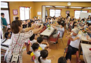
“高齢者どうしの憩いの場所”