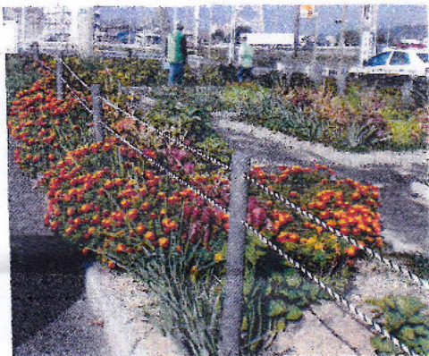
通学路に鮮やかなマリ-コールド

11/5(土) 9:00~11:30 河辺 石田 坂上 五家 関根 中筋 芦田 (抜か)むぎのこさん