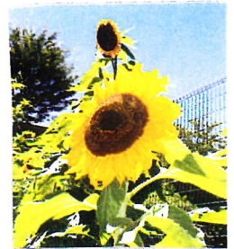
上で父親が見守っているよう

もうすぐ、後ろを向いて、頭を垂れる。何故か? グリーンパトの人には皆知っているから教えてあげて!