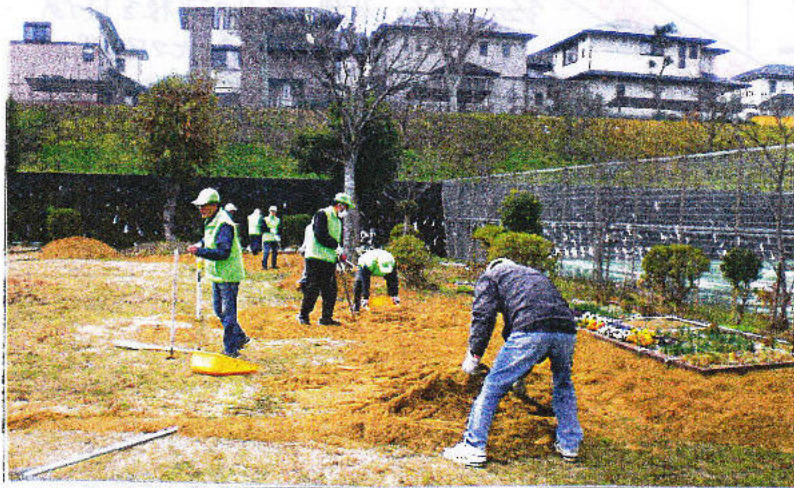
土ならしの道具は持つだけでも重い。(トンボといんだって)