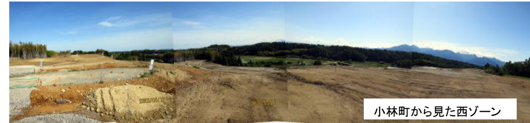
小林町から見た西ゾーン