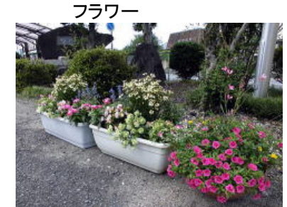
内部地区市民センター すいせんの会