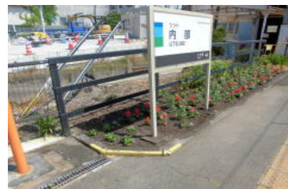
内部駅 花を育てる会

地域のボランティアの皆さんにより、今年も5月から6月にかけて下記の花壇に善意の花が植えられました。各地区で活動されている8つの団体の皆様には感謝申し上げます。