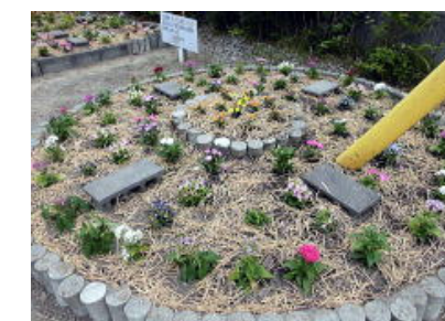
小古曾6丁目県道沿い花壇 高塚町花を愛する会