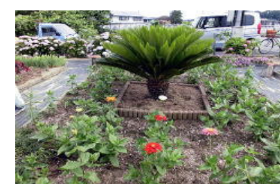
内部交番南側広場 采女が丘グリーンパトロール