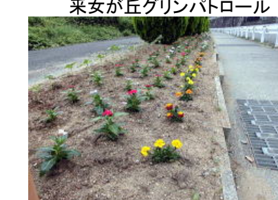
内部東小学校入口 采女町北部長寿会