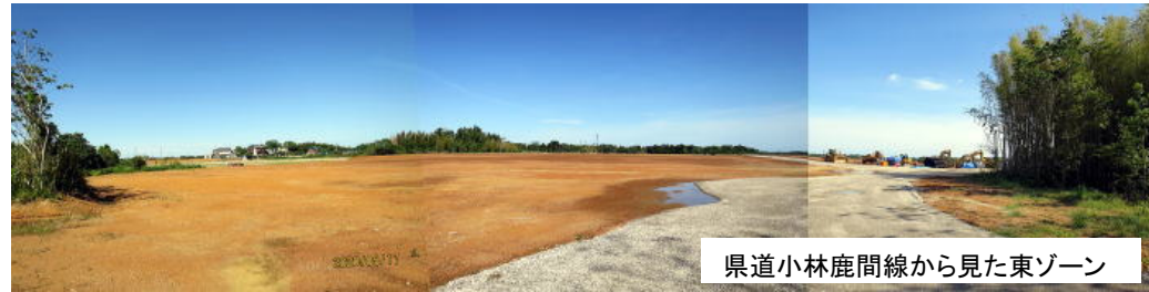
県道小林鹿間線から見た東ゾーン

2019年2月から始まった足見川メガソーラーの整地工事はかなり進み、2020年5月時点で、敷地境界からは一面整地された広大な平地が見渡せます。