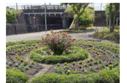
内部橋南詰公園 フラワー