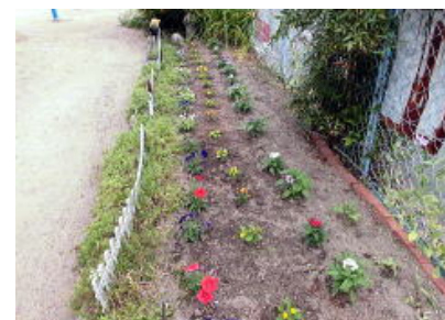
小古曾1号公園 東原自治会