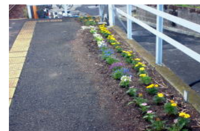
小古曾駅 花を育てる会